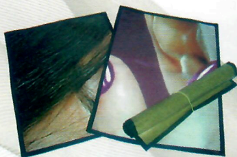
Jogo Americano Retangular (ref. 09)

(opções de modelo: Retangular, Entrancado e Redondo)