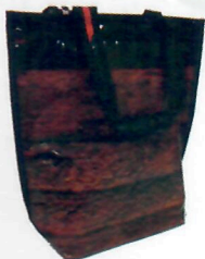
Sacola P (ref. 31) (opções de tamanho P, M e G)