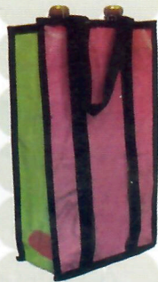
Porta Vinho 2 Garrafas (ref. 26) (opções de 1, 2 ou 4 garrafas)