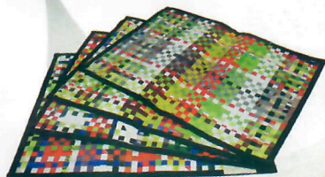
Jogo Americano Entrançado (ref. 52) (opções de modelo: Retangular, Entrançado e Redondo)