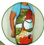
Avental (ref. 01)