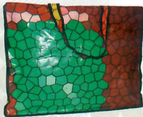
Sacolão (ref. 14)