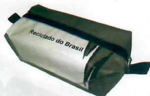
Necessaire (ref. 16)