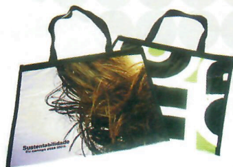
Sacola Pasta (ref. 03)