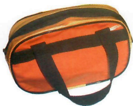
Mini Frasqueira (ref. 02)