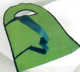
Lixeiro Marcha (ref. 13)

(opções de modelo: Retangular, Entrancado e Redondo)