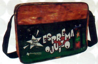
Bolsa Congresso (ref. 24)