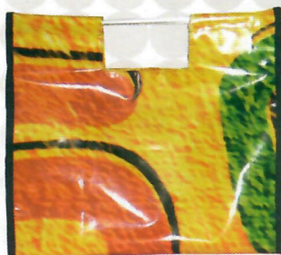
Sacola com Alça de Alumínio (ref. 54)