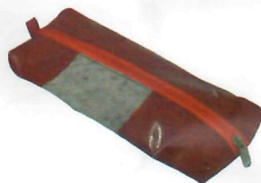
Porta Lápis (ref. 22)