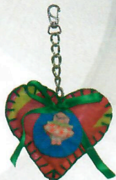
Chaveiro P (ref. 41) (opções de tamanho P e G)