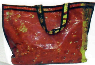
Sacola G (ref. 29) (opções de tamanho P, M e G)