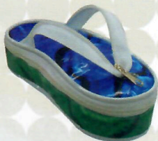
Estojo Sandália (ref. 25)