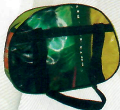
Frasqueira (ref. 08)