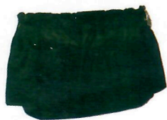
Organizador de Bolsa (ref. 53)